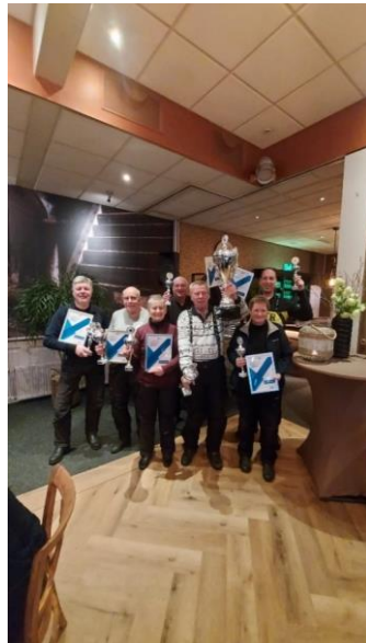
Winnaar Rijdersclassament Winnaars clubclassament

De dag werd afgesloten met een drankje en een dankwoord aan de organisatie.