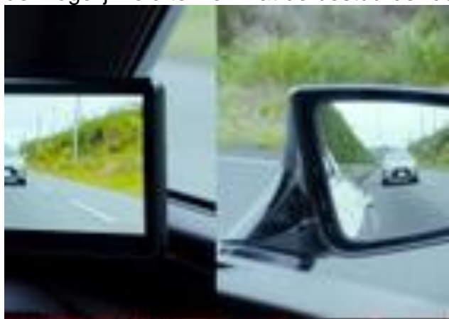
Foto onder: Een vergelijking met het zicht dat je met een normale spiegel (rechts) en de camera (links) hebt. De camera heeft duidelijk een groter bereik maar ontnemt andere weggebruikers de mogelijkheid te zien wat de bestuurder doet.

Al in 2016 oordeelde de Europese Unie dat een camerasysteem conventionele spiegels kan en mag vervangen. Het systeem dat door met name door BMW, Audi en Lexus in productie is genomen wordt ook al toegepast op luxere modellen die gewoon in de showrooms staan. Toch zie je het fenomeen op straat eigenlijk nog niet. Dat komt omdat de camera's nog niet in de eigen wetgeving is opgenomen. Rij je er mee rond dan kan de politie je dus aanhouden wegens het ontbreken van spiegels. Goedkeuring van het RDW is pas mogelijk als de Nederlandse wet zegt dat het toegestaan is. Zij denken dat dat in 2020 zal gebeuren.